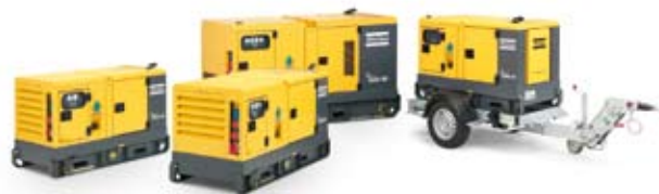
Nouveaux modèles: compacts et économiques en carburant

communales. Il existe des génératrices sur patins ou sur roues. Mais également des combinaisons qui intègrent un éclairage en hauteur. Les génératrices Atlas Copco: du courant partout et toujours.