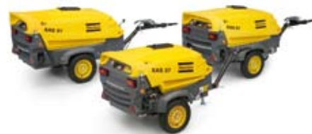
Nouvelle génération: fiable et design agréable

ouverture du capot et l'accès optimal à tous les composants importants.